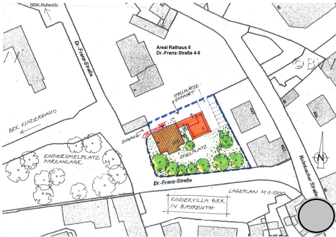
(Optionale Planung Anbau)